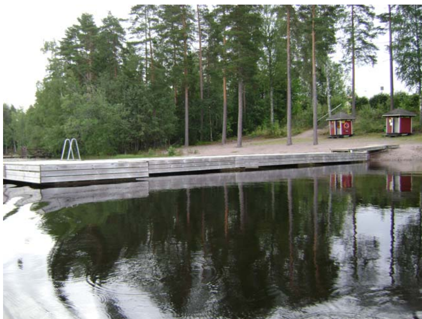
Kuva 2. Hollolan kunnan uimaranta

Osakaskunnilla on oma veneranta sekä kunnalla omaa ranta-aluetta. Uimarannalla, kunnan rannalla ja palokunnan rannassa on laiturit.