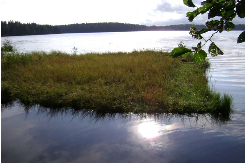
Kuva 3. Työtjärven turvelautta